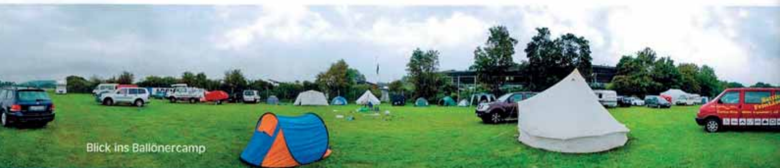
Blick ins Ballönercamp