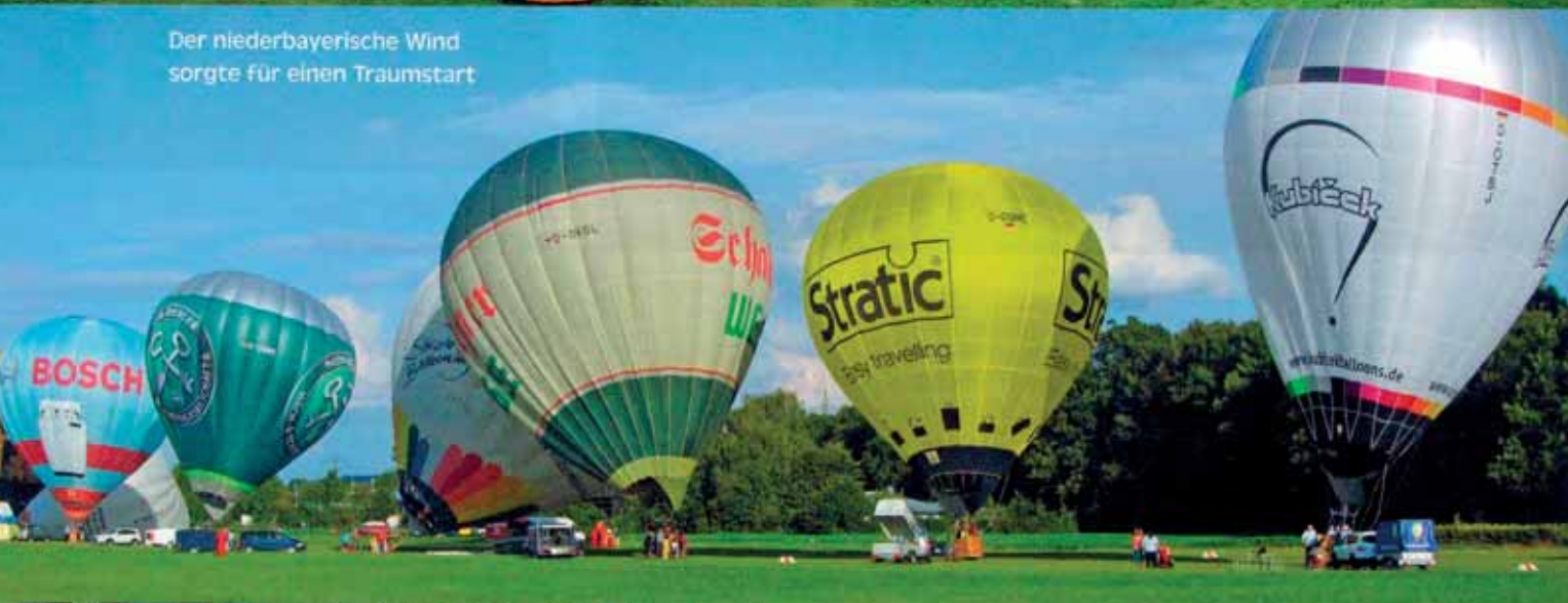
Der niederbayerische Wind sorgte für einen Traumstart