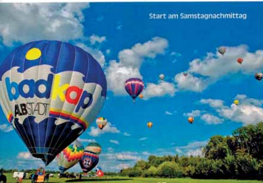
Start am Samstagnachmittag