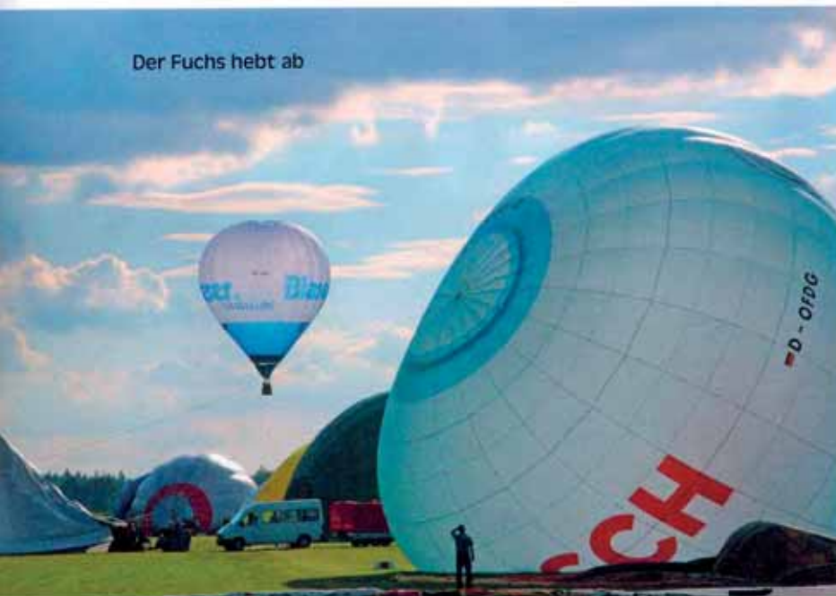
Der Fuchs hebt ab