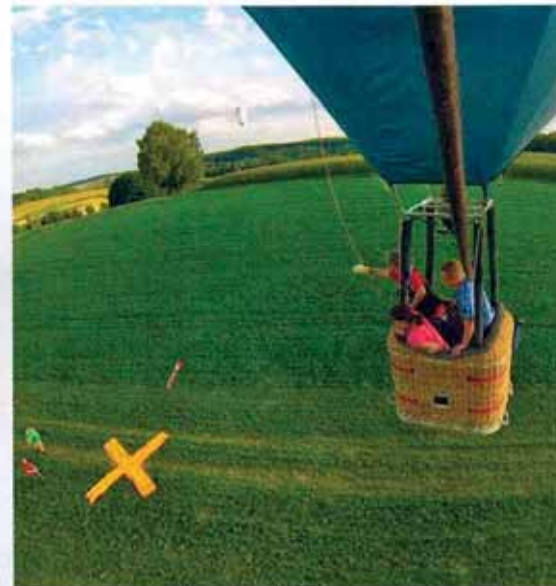
Oben: Der beste Marker auf dem Weg zum Ziel